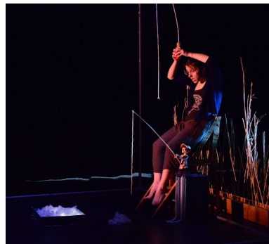
Structure en alliage avec bacs à blé et accessoires

Initiales de la structure d'accueil _____ Initiales de Cabane Théâtre _____